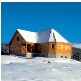
Puerto de La Ragua