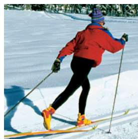
Esquí de Fondo

Los amantes de los deportes blancos cuentan en la provincia con la Estación de Sierra Nevada, con 84 km. de pistas para la práctica de todos los deportes de nieve y La Ragua, sólo para el esquí de fondo